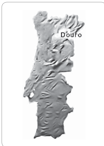
FIGURA 1 Localização da região Demarcada do Douro no território português